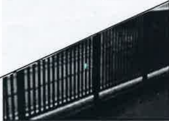
●眺望写真(平成30年1月撮影)